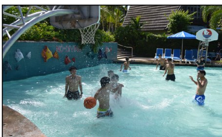
PIC ホテルのプライベートプール