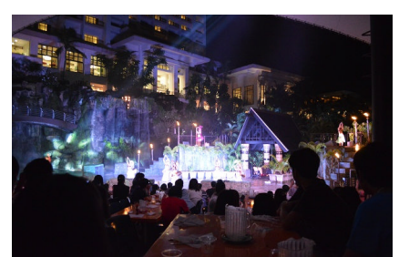
ポリネシアンダンス ディナーショー