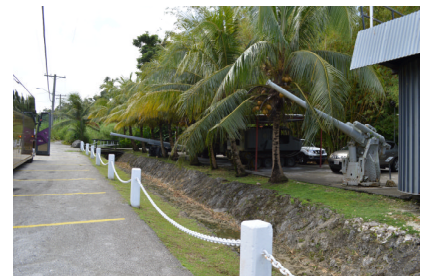
太平洋戦争歴史博物館