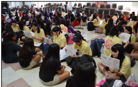
Agueda I. Johnston middle School との学校交流の様子