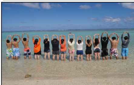
ココス島の海は、信じられない程、青く透き通っていました