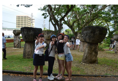
ラッテストーン公園